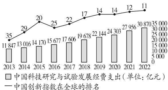
2013—2022 年中国科技发展经费支出 与创新指数排名